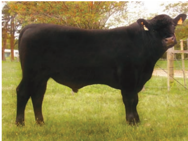
foto a los 18 meses de edad con 530 kg de peso-FRAME 5